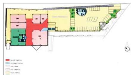
Pianta Livello 2