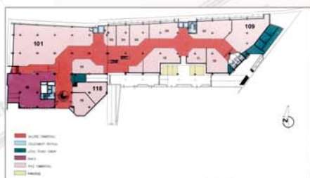
Pianta Livello 0

Il Noal sorge in pieno centro urbano ed è servito dalla principale strada della città.